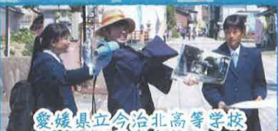
愛媛県立今治北高等学校 大三島分校

大三島分校は、しまなみ海道のほぼ中央に位置する大三島にある島内唯一の公立高校である。大三島は急速に少子高齢化が進んでおり、地域の活性化と学校の存続が大きな課題である。大山祇神社を中心とした観光など、一部では賑わいを見せているものの、それが定住人口の増加にはあまり結びついていない。そこで、大三島の魅力の発信と創出を行うため様々な地域活性化活動に取り組んでいる。具体的な活動として、大山祇神社参道のボランティアガイド、伊東建築塾と協働した建築やデザインを通して島を元気にする活動「瀬戸内島しゅ部高校との交流、高校生目線で大三島を紹介するパンフレット「私たちの大三島」の作成、移住者の島での仕事を紹介するパンフレット「大三島お仕事図鑑」の作成、地域おこしイベントの創出などがある。これらの活動を通して、定住人口の増加を図るとともに、私たち高校生自身が島のことを深く理解し郷土を愛する気持ちを新たにすべく、今後も活動を継続・発展させていきたい。