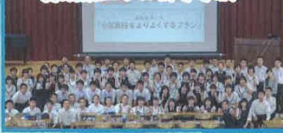
愛媛県立小田高等学校

愛媛県立小田高等学校では、様々な教育活動を通して、社会・地域における人々の信頼関係や結びつきを生み出し、新たな取組への礎とすることが、地域コミュニティの維持・地域活性化に繋がると考えています。本校には、総合的な学習・探究の時間を中心に展開する「小田高版・起業家教育プログラム」があります。本プログラムでは、内子町小田をフィールドとし、産官学の協力に加え県外や海外協力機関との連携を通し、地域の魅力や課題の発見、地域デザイン等に取り組んでいます。プログラムコンセプトとして、「地域資源の教材化」、「外部講師・地域人講師の積極的な活用」を掲げており、昨年度は延べ40名を超える外部講師に講座を担当していただきました。また、プログラム内容の企画・立案に関しては、先生方だけでなく、地域、企業等の意見に加え、私たち高校生の意見も反映されるよう仕組みづくりがされているのも特徴の一つです。私たちは、本プログラムを中心とした本校での教育活動を通して、ソーシャルキャピタルの蓄積を目指しています。