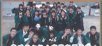
愛媛県立松山商業高等学校

松山商業高校地域ビジネス科は、平成29年度にスタートした新しい学科で、今年度3学年がそろう。「地域の魅力の再確認と新たな魅力を創造する活動を通して、地域に対する愛情と誇りを醸成するとともに、地域の活性化に貢献しようとする使命感を育成する」「習得した知識や技術を活用する能力や創造性に富んだ企画力、積極的な実践力の獲得に加え、周囲とのつながりを構築し、協働しようとする力を育成する」などといった学科の目標を地域社会と共有し、学校内外の様々なフィールドで実践的・体験的学習、課題解決型の学習を展開している。これまで、地元商店街の歴史や現状について学ぶフィールドワークや、高知県を訪問しての防災研修、近隣の保育施設での防災教室の開催、南予第一次産業、東予第二次産業企業見学、愛媛の魅力PRするポスターの作成とそれらを高知県内で掲示することによるPR活動、松山市外の高校生をお迎えする松山観光ツアーガイドの実践、地域のマルシェや朝市へブースを出店し賑わいを創出する活動、三津浜地域に人を呼び込むイベントの開催など、様々な活動を行っている。