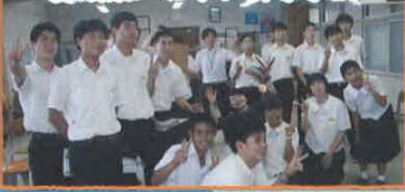
愛媛県立北宇和高等学校

愛媛県北宇和郡鬼北町は、日本で唯一、「鬼」の名が付く自治体であり、そのことを生かした魅力づくりと産業おこしを目的とした「鬼の町づくり」が進められている。愛媛県立北宇和高校は、過疎化の進む県南西部鬼北地域の拠点として、その存続を必要とされており、高校生段階で、地元地域の産業や文化等への理解を深めていくことで、地元への定着やリターン等を促進させることができると考える。高校生が地域の課題や問題点を探究し、その解決策を模索しながら、町づくりに参画することで、地域の魅力を引き出す企画力や実践力、他者と連携しながら解決策を提案できる力を身に付け、町づくりへの参画を通して、地域活性化に貢献する人材を育成することを目標とし、活動している。