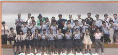
愛媛県立三崎高等学校

三崎高校(みさこう)は、西予和郡伊方町で唯一の高校である。伊方町においては、進学や就職を機に都市部へ転出する生徒が多く、地域の担い手不足が深刻化している。そこで、地域を担う存在である高校生が、行政や関係団体、地域の方とともに活動する中で地域の良さを再発見し、地域に誇りを持った社会人となり「ブーメラン人材」として地域に帰ってくるという、長期的な地域の活性化に取り組むことを目指し、本プロジェクトを作成した。昨年度は廃校となった中学校を活用したアートイベント「佐田岬ジャンボリー」、三崎高校及び伊方町をPRするためにプロの映像作家と本校生徒が協働で作成した映画「せんたんビギンズ」、そして、毎年9月に行っている、県内外で地域活性化活動を行っている高校生や大学生を集めたフォーラム「せんたんミーティング」など、様々なイベントを企画した。生徒一人ひとりが、地域問題に対して当事者意識を持ち、「ふるさとを元気にしたい!」という思いの下、今後も活動を続けていく。