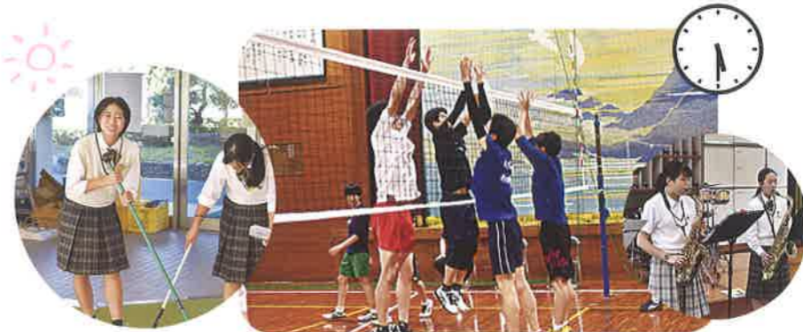
放課後は部活動！「一生懸命」部活に取り組む みさこう生はカッコいい！