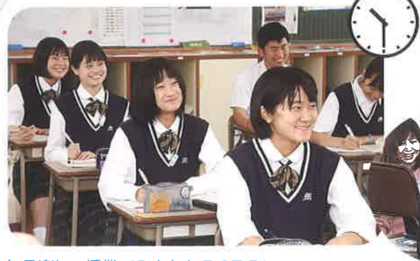
毎日楽しい授業でみんなもワクワク！ みてください！みさこう生のステキな笑顔！