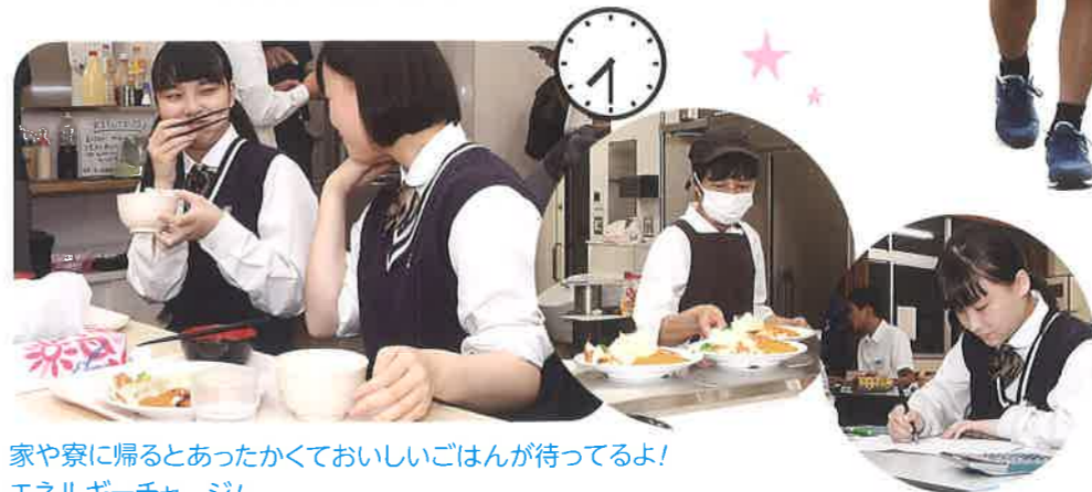
家や寮に帰るとあったかくておいしいごはんが待ってるよ！ エネルギーチャージ！